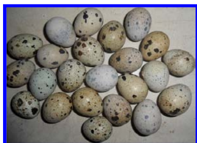
Les oeufs de cailles