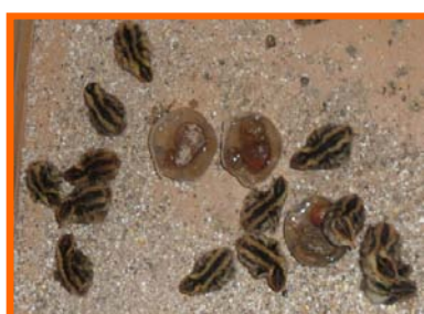
Les cailleaux de 1 jour