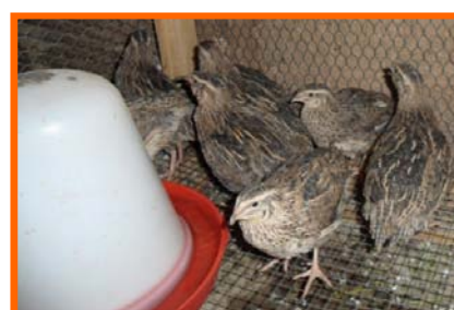
Les Cailles de 7 semaines