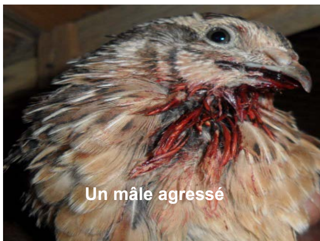
Un mâle agressé

Les mâles et les femelles se reconnaissent à partir de 3 semaines. Les mâles se reconnaissent à leur plumage uniforme sous la gorge et les femelles par leur plumage tacheté de noir sous la gorge.