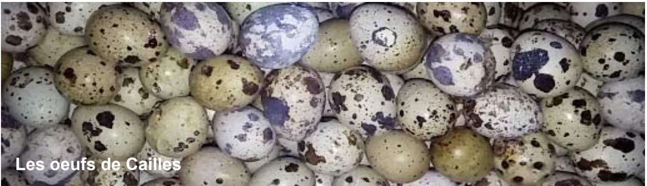
Les oeufs de Cailles

D ans un élevage de cailles, pour prévenir les maladies, vous devez tenir les lieux toujours propres. Les cailles sont très rustiques et il n'y a pas de prophylaxie particulière. Ce n'est pas pour cela qu'elles sont à l'abri d'autres maladies transmissibles telles que la variole aviaire, le coryza, la grippe aviaire. Ces maladies sont généralement constatées surtout quand elles sont élevées avec d'autres volailles ou à proximité d'autres volailles.